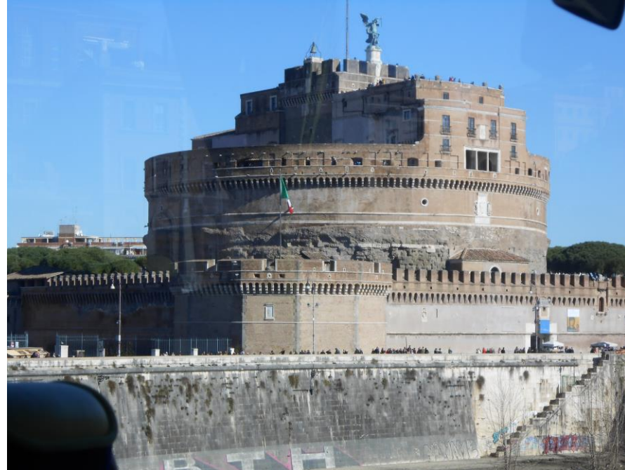
Numéro de la photo (verticale) Photo 2

Le Colisée est le symbole principal de Rome. Une construction imposante qui ramène le visiteur dans le temps pour découvrir le mode de vie de l'Empire romaine.