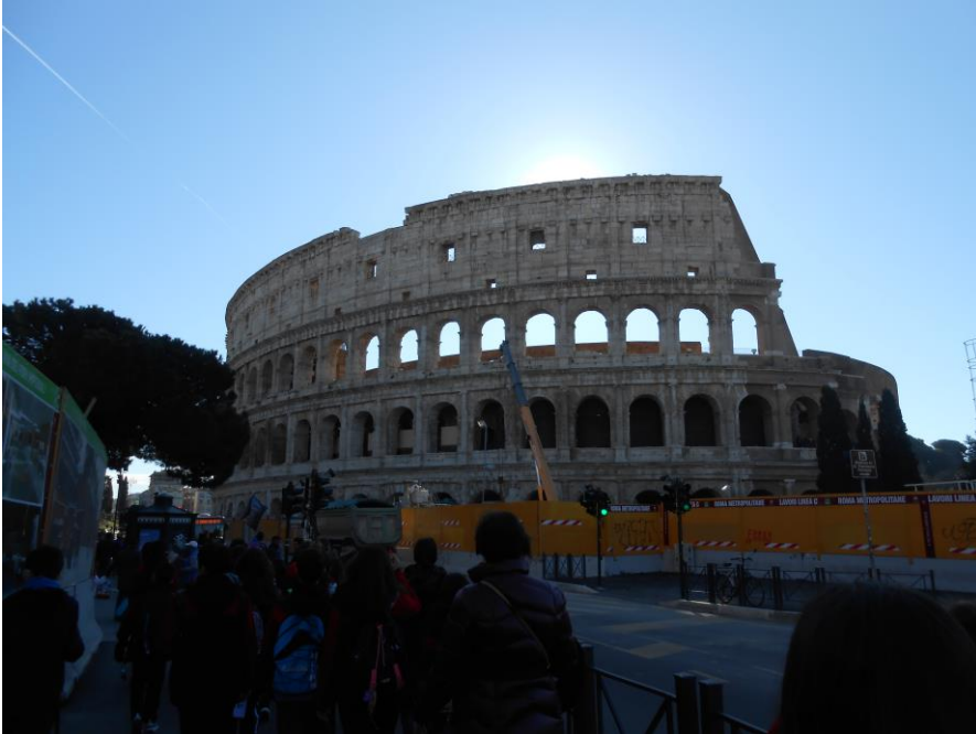
Numéro de la photo (verticale) Photo 1